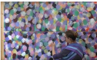
FRANCESCA ASCIONE OFFERING FOR MAITRI