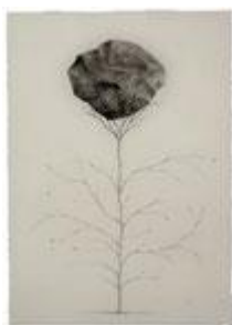
OSCAR TURCO ELOGIO DELLA FRAGILITA' Opere su carta