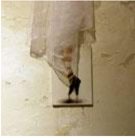
KEZIAT IRREALTA' QUOTIDIANA Videoinstallazione