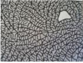
ONO EMILIANI SCORRERE