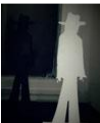
LILLO BARTOLONI STORIE DI OMBRE E DI SILENZI